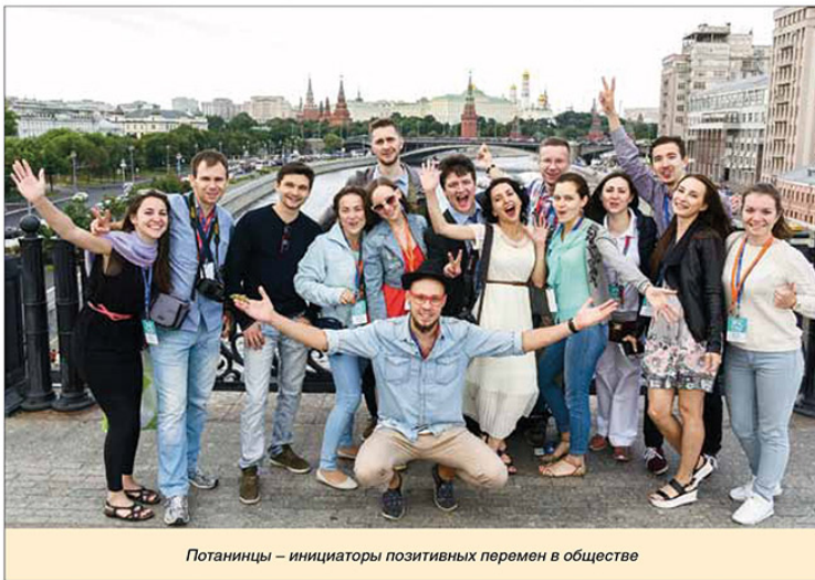
Потанинцы – инициаторы позитивных перемен в обществе