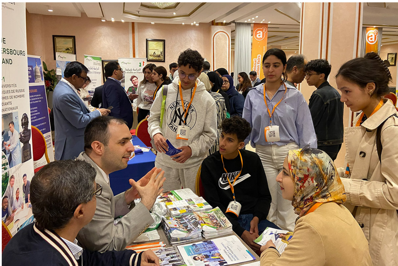
Политех на международных образовательных выставках

Весной Политехнический университет принял участие в трех международных образовательных выставках в ОАЭ, Алжире и Марокко. Такие мероприятия способствуют установлению контактов с иностранными абитуриентами, обмену опытом с другими университетами и продвижению международного сотрудничества в сфере образования.